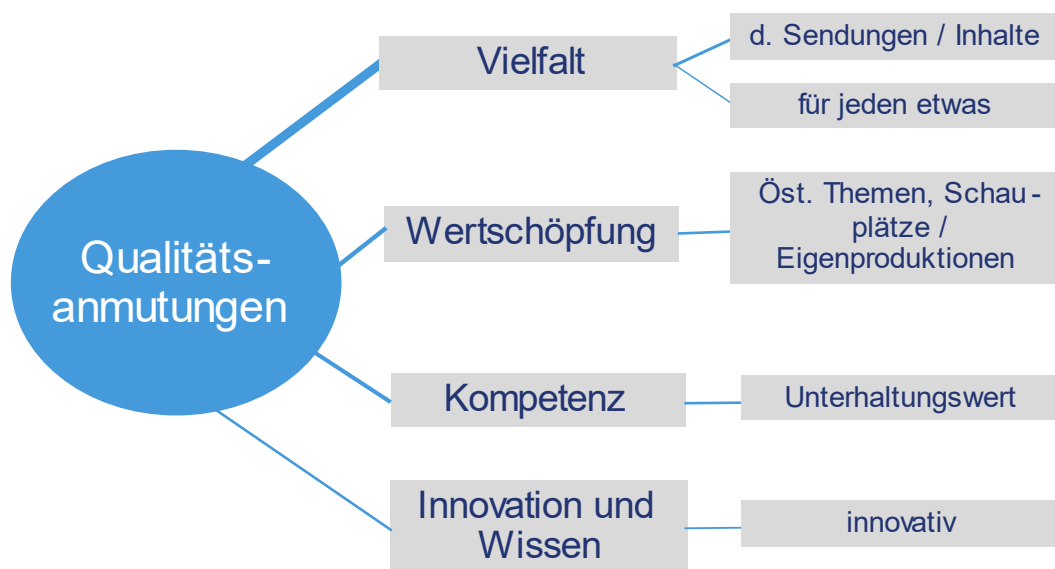
Abbildung 3: Qualitätsanmutungen des Publikums – Antworten auf offene Fragen in der Eingangsphase der qualitativen Interviews

Anm.: Die Stärke der blauen Verbindungslinien repräsentiert die Häufigkeit, mit der die Befragten das jeweilige Qualitätsmerkmal thematisiert haben (n=179 codierte Aussagen, Mehrfachantworten).