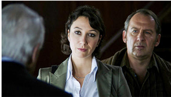
Abbildung 4: Schnell ermittelt mit Ursula Strauss und Wolf Bachofner

auch mit Themen wie Religion. Es wurden vier Staffeln produziert (2007-2011), die nicht nur im Programm des ORF sondern unter anderem auch in Dänemark, Frankreich, Italien, Kasachstan, Litauen, Russland, Slowenien und der Ukraine ausgestrahlt wurden.