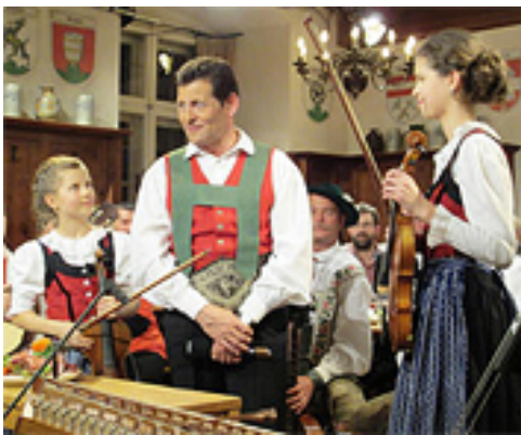
Abbildung 7: Mei liabste Weis' mit Franz Posch

Die seit 1988 gesendete Live-Show wird vom Volksmusiker Franz Posch (zusammen mit Ko-Moderatorinnen und -Moderatoren) präsentiert und seit 1991 in ORF 2 im Abendprogramm ausgestrahlt. Die Volksmusiksendung findet in geeigneten Wirtshäusern in verschiedenen Regionen Österreichs und angrenzender Nachbarländer statt und kann folglich ein Vor-Ort-Präsenzpublikum einbauen. Sie präsentiert traditionelle Volksmusik, die von etablierten wie neuen Gruppen und Einzelmusikerinnen und -musikern aus den verschiedensten Regionen live aufgeführt wird. Ergänzt wird die Sendung durch Kurzinterviews mit Personen aus dem Publikum und mit filmischen Einspielern, die Geschichte, landschaftliche Schönheiten und Traditionen der Regionen aufgreifen und dem Publikum bekannt machen. Sowohl das Präsenzpublikum als auch das Fernsehpublikum werden in die Sendung durch Berücksichtigung ihrer Musikwünsche eingebunden.