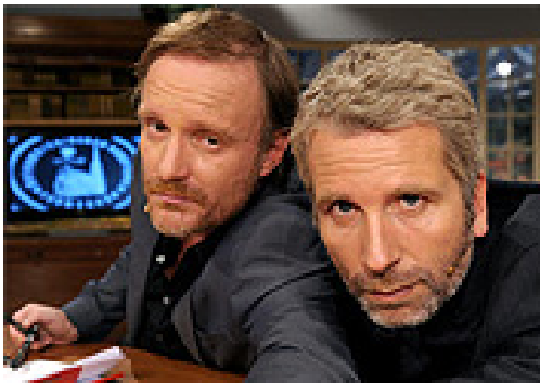
Abbildung 6: Willkommen Österreich mit Dirk Stermann und Christoph Grisseemann

Willkommen Österreich ist das Flaggschiff der Comedy-Schiene des ORF Die.Nacht. Dirk Stermann und Christoph Grisseemann, die ihre Karrieren im ORF-Radio fm4 begonnen haben, beschäftigen sich dabei humoristisch mit aktuellen Themen, unter anderem aus Politik und Gesellschaft. Im zweiten Teil der Sendung sind Prominente zu Gast, die von dem Moderatoren-Duo interviewt werden. Dieses Konzept aus Kabarett-Teil zu Beginn und dem Gespräch mit Autoren, Schauspielern oder Musikern im Anschluss wird um diverse Einspieler, zum Beispiel diverse Parodien, erweitert. Zudem werden die Moderatoren im Studio von einer Band unterstützt. Die Sendungen werden jeweils im Vorfeld vor Publikum aufgezeichnet. Seit 2007 wurden 245 Sendungen ausgestrahlt.