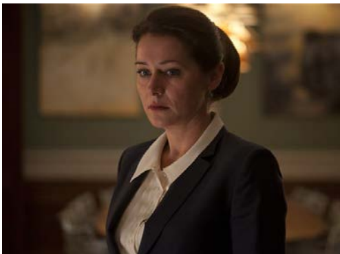
Abbildung 3: Borgen mit Sidse Babett Knudsen als fiktive Premierministerin Birgitte Nyborg