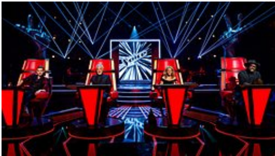
Abbildung 5: The Voice UK