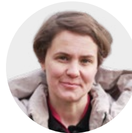
Ajda Sticker „betrifft: uns – Reportagen ohne Filter“

„betrifft: uns – Reportagen ohne Filter“ ist als Nachfolgeformat für die Sendung „Heimat fremde Heimat“ entstanden und hat den Anspruch, dass wir die Themen eines multiethnischen Zusammenlebens in eine moderne Zeit bringen. In Österreich leben ja viele Menschen mit diversen Migrationshintergründen. Und wir wollen die Chancen, aber auch die Herausforderungen dieses multiethnischen Zusammenlebens in Österreich zeigen, indem wir in die Communitys gehen, indem wir uns auch dem widmen, was der Urösterreicher, die Urösterreicherin für Sorgen hat und versuchen, das in einer 30-minütigen Reportage zusammenzubinden.